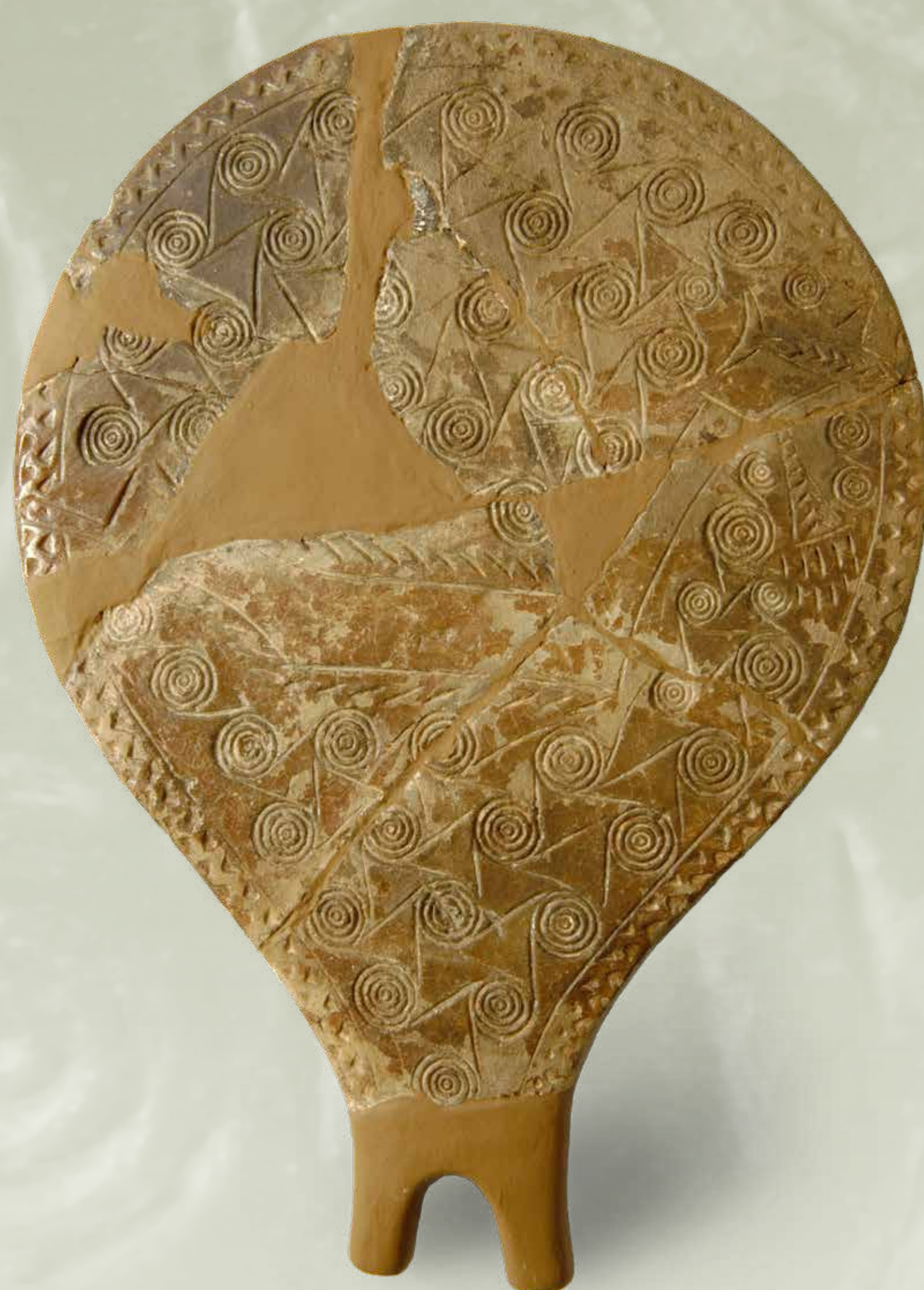
Τηγανόσχημο σκεύος από πήλο (ΕΑΜ Π 6177.1) 2800-2300 π.Χ. (Πρωτοκυκλαδική ΙΙ περίοδος) Σύρος, νεκροταφείο Χαλανδριανής

Η χάλκινη λέμβος από την προϊστορική πόλη στην Αγία Ειρήνη της Κέας βρέθηκε μαζί με ένα επίσης χάλκινο ειδώλιο λατρευτή σε ένα ορθογώνιο κτήριο με πολλά δωμάτια, τον ονομαζόμενο ναό που στέγαζε πήλινα αγαλμάτια της 'θεότητας'. Ένας μικρός Οδυσσεύς μπορεί να είχε προσφέρει στη θεότητα τη μικρογραφία λέμβου ως ένδειξη ευγνωμοσύνης για το αίσιο πέρας ενός δικού του ταξιδιού μέσα σε τρικυμία. Αυτός ο τύπος πλοίου ήταν εξαιρετικά διαδεδομένος στη Μινωική Κρήτη και στις Κυκλάδες χιλιάδες χρόνια πριν από σήμερα.